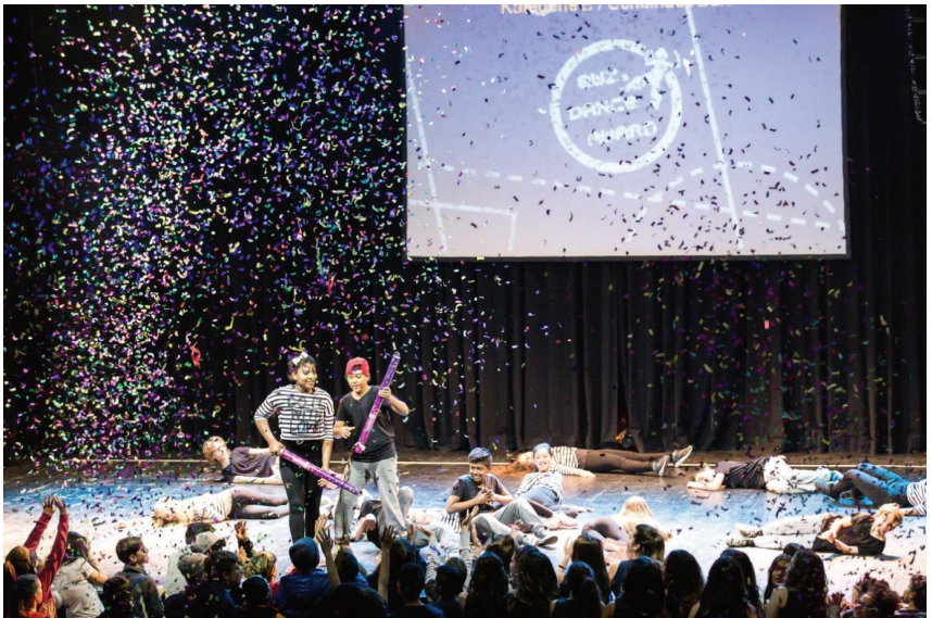
EWZ Dance Award