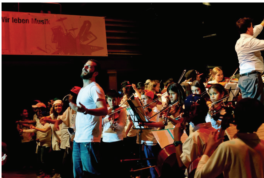
Bligg Konzert für Schulklassen